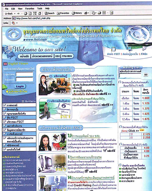
10.3 เผยแพร่ข้อมูลข่าวสาร ผลการดำเนินงาน และบริการของ ชสอ. ผ่านสื่ออินเทอร์เน็ตเว็บไซต์ http://www.fsct.com ในรอบปีที่ผ่านมามีผู้ใช้บริการทั้งสิ้น 21,000 ครั้ง และติดต่อสอบถามผ่านทาง e-mail address : info@fsct.com จำนวน 210 ครั้ง