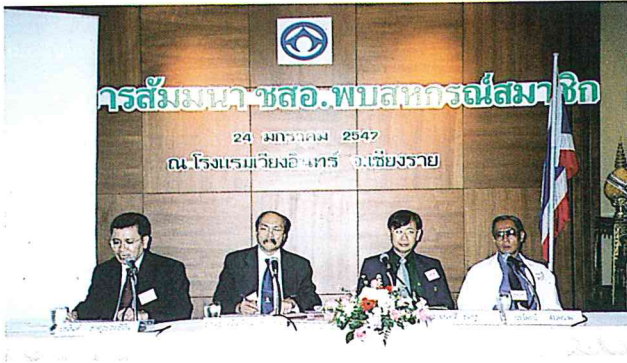
10.2 จัดโครงการสัมมนา ชสอ. พบสหกรณ์สมาชิกในภาคต่างๆ รวม 5 ครั้ง มีผู้เข้าสัมมนา รวม 443 คน จาก 226 สหกรณ์