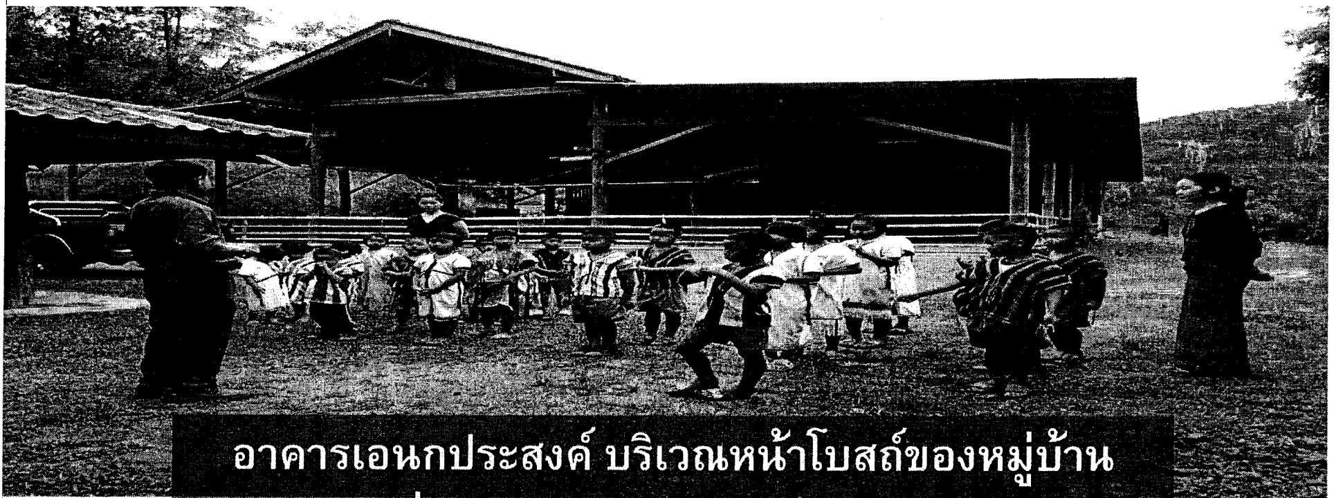
อาคารเอนกประสงค์ บริเวณหน้าโบสถ์ของหมู่บ้าน อาคารเรียนชั่วคราวของศูนย์การเรียนรู้ ตชด. บ้านแม่ขอ (สภาพปัจจุบัน)