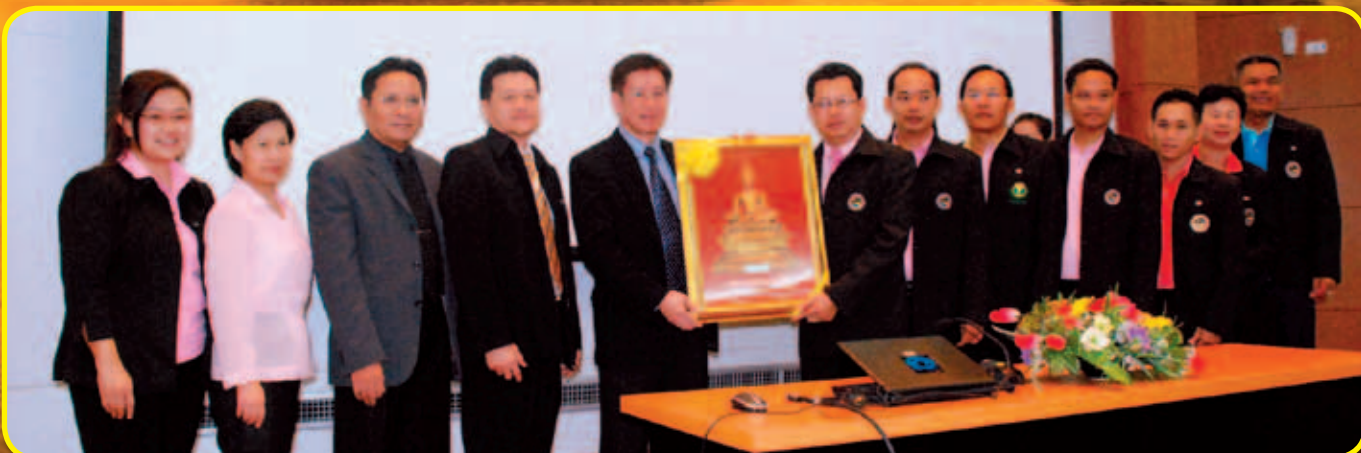
สภกรณ์ออมทรัพย์สาธารณสุขทบองคาศย จำกัด