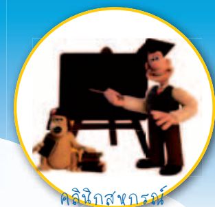
ศิลปินกราฟิก