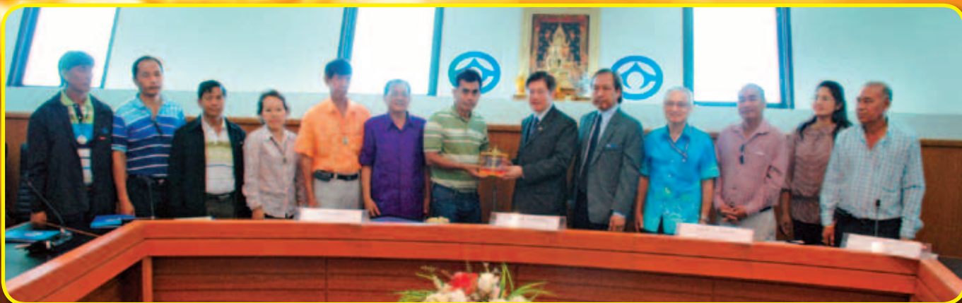
สภกรณ์ออมทรัพย์กรุงศรีธรรมาช จำกัด