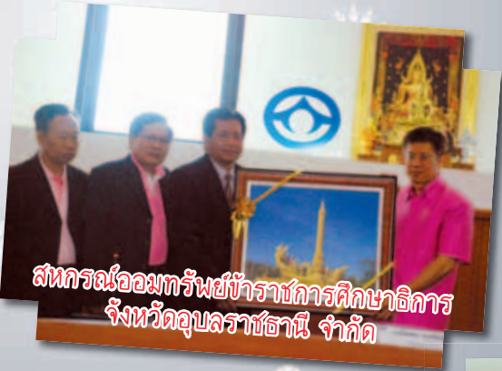
สหกรณ์ออมทรัพย์ข้าราชการการศึกษาธิการ จังหวัดอุบลราชธานี จำกัด