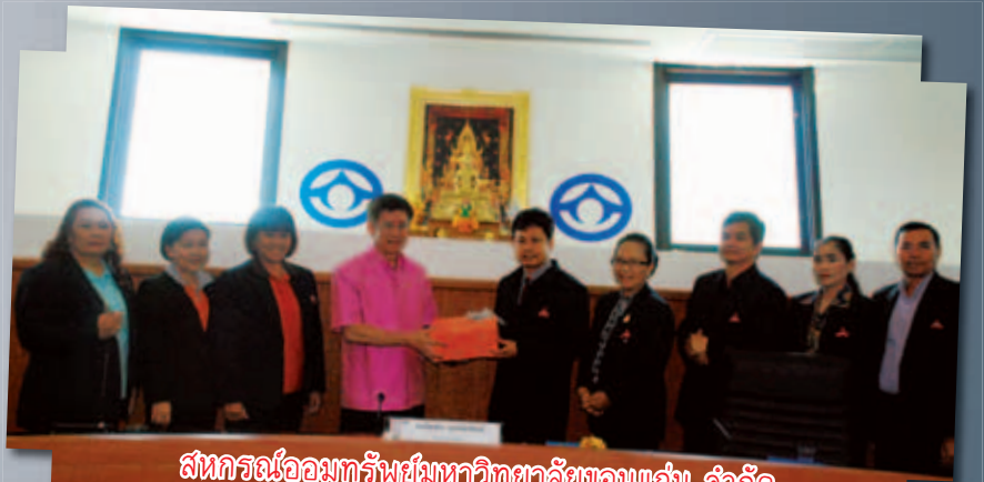
สหกรณ์ออมทรัพย์มหาวิทยาลัยขอนแก่น จำกัด