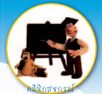
คลังสารสนเทศ