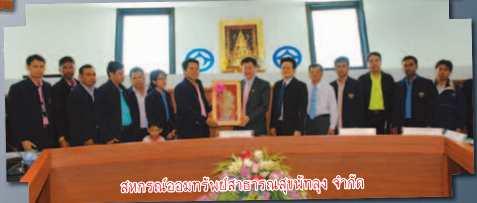
สหกรณ์ออมทรัพย์สาธารณสุขสุรินทร์ จำกัด