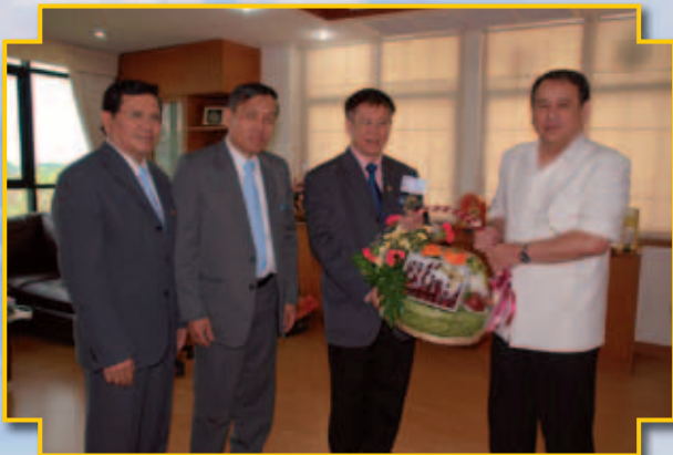
นายฉกรรจ์ แสงรักษาวงศ์ อธิบดีกรมส่งเสริมสหกรณ์