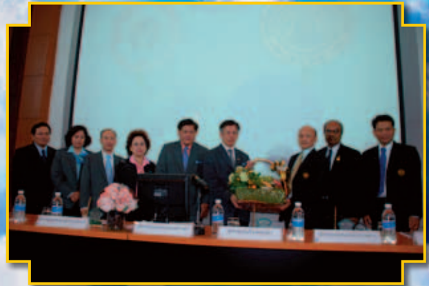
ชุมนุมสหกรณ์เครดิตยูเนียนแห่งประเทศไทย จำกัด