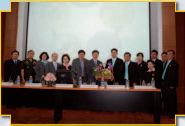
ชุมนุมร้านค้าสหกรณ์แห่งประเทศไทย จำกัด