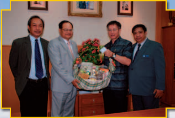
นายธีระ วงศ์สมุทร รัฐมนตรีว่าการกระทรวงเกษตรและสหกรณ์