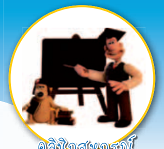
คลื่นวิทยุ