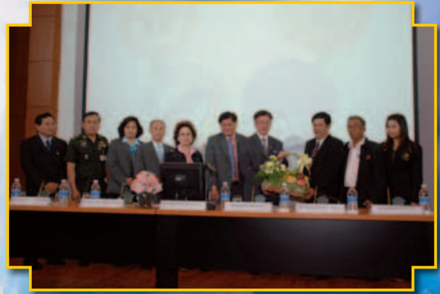
ชุมนุมสหกรณ์บริการเดินรถแห่งประเทศไทย จำกัด