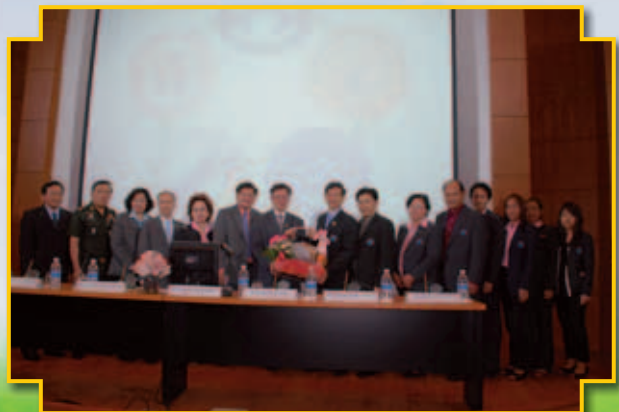
สันนิบาตสหกรณ์แห่งประเทศไทย