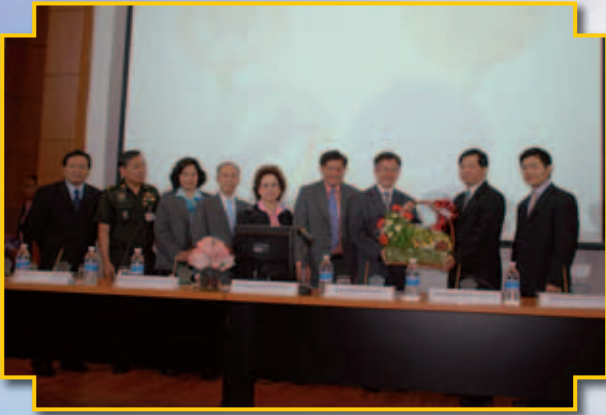
ชุมนุมสหกรณ์การเกษตรแห่งประเทศไทย จำกัด